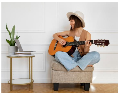
Suonare uno strumento