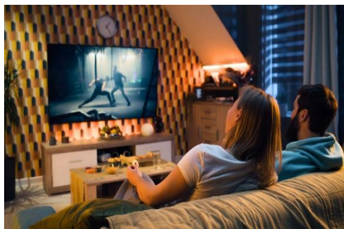
Guardare film e serie tv