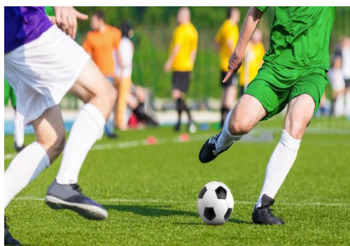
Giocare a calcio